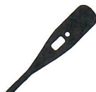
Verhoging of koorts