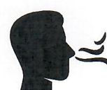
Reuk- en/of smaak- verlies

Heb je op dit moment een huisgenoot met milde klachten en koorts en/of benauwdheid?